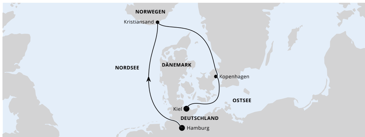
Die Karte zeigt eine optisch vereinfachte Route. Änderungen vorbehalten.

AIDAluna | 4 Tage | März und September 2024