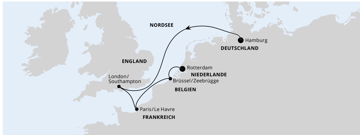
Die Karte zeigt eine optisch vereinfachte Route. Änderungen vorbehalten.