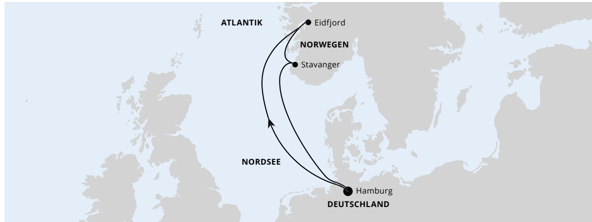
Die Karte zeigt eine optisch vereinfachte Route. Änderungen vorbehalten.

AIDA Sol | 5 Tage | Juni und Oktober 2024