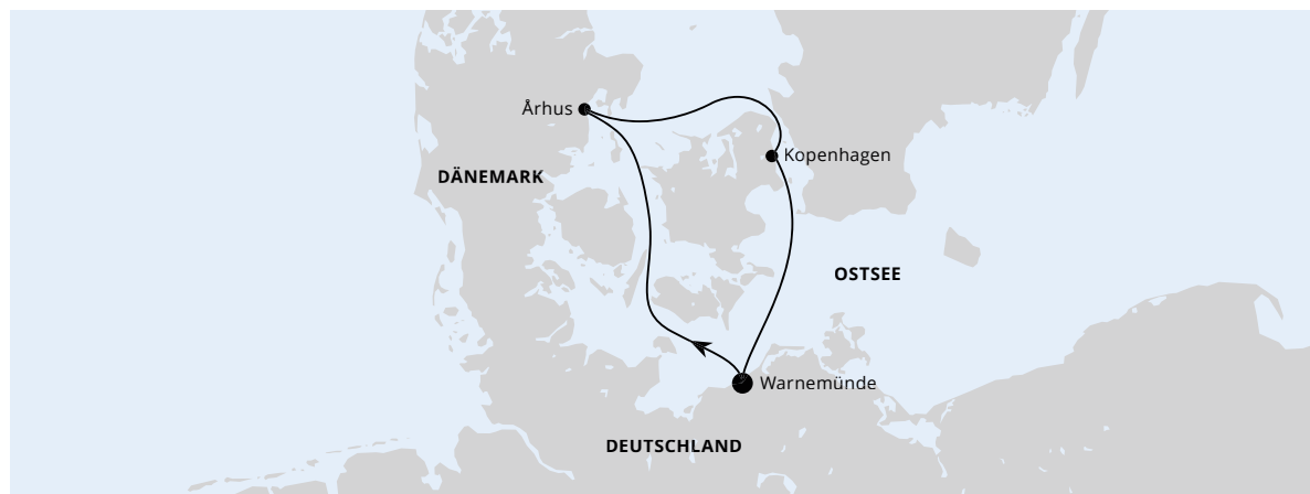
Die Karte zeigt eine optisch vereinfachte Route. Änderungen vorbehalten.