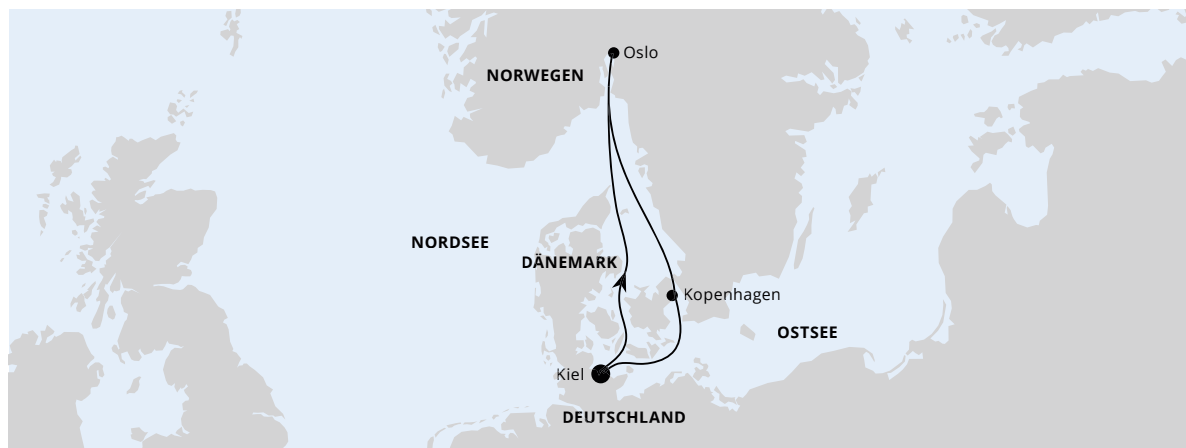
Die Karte zeigt eine optisch vereinfachte Route. Änderungen vorbehalten.

AIDA luna | 4 Tage | April, Mai, September und Oktober 2024