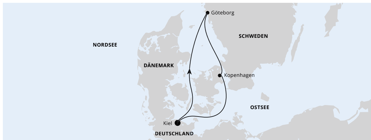
Die Karte zeigt eine optisch vereinfachte Route. Änderungen vorbehalten.

AIDAluna | 3 Tage | April, Mai und September 2024