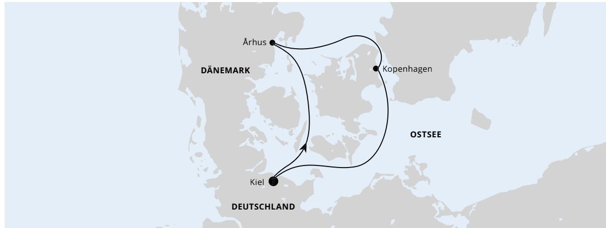
Die Karte zeigt eine optisch vereinfachte Route. Änderungen vorbehalten.

AIDAluna | 3 Tage | April, Mai, September und Oktober 2024