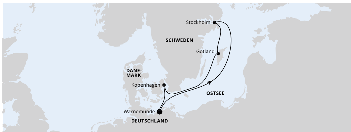
Die Karte zeigt eine optisch vereinfachte Route. Änderungen vorbehalten.

AIDamar | 5 Tage | April, Mai und Juli 2024