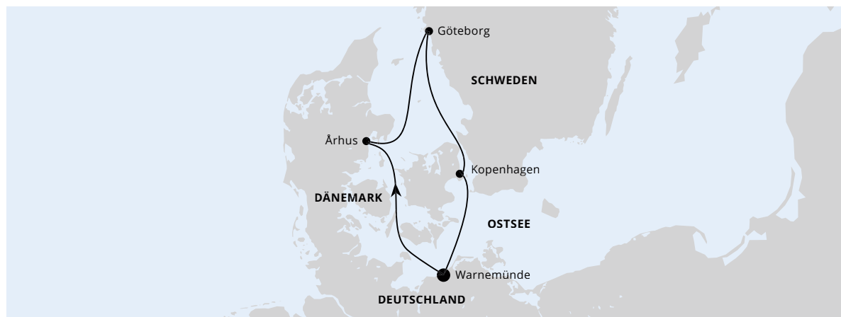
Die Karte zeigt eine optisch vereinfachte Route. Änderungen vorbehalten.