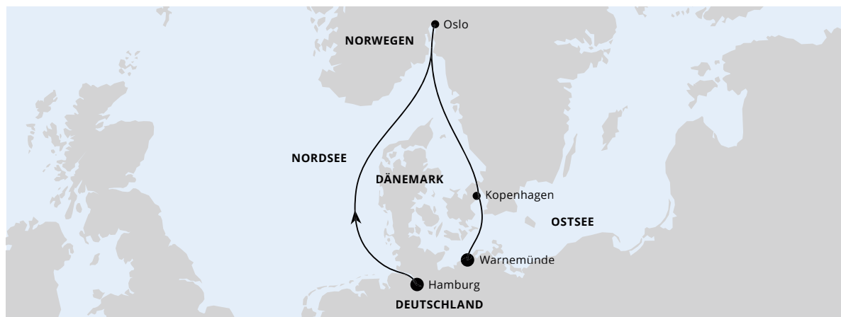
Die Karte zeigt eine optisch vereinfachte Route. Änderungen vorbehalten.