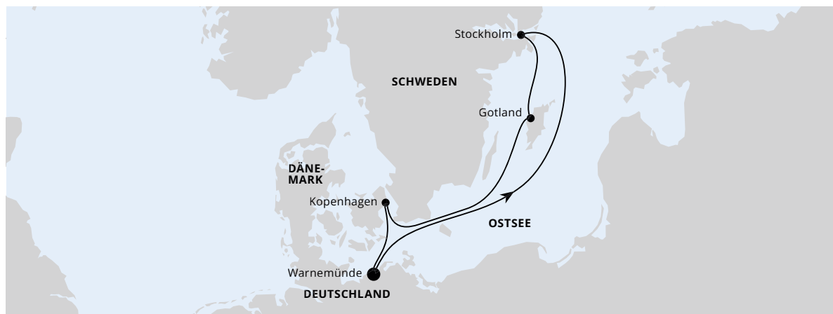
Die Karte zeigt eine optisch vereinfachte Route. Änderungen vorbehalten.