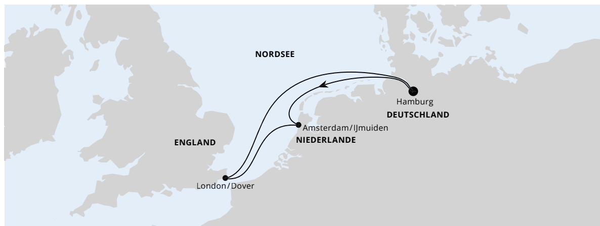
Die Karte zeigt eine optisch vereinfachte Route. Änderungen vorbehalten.