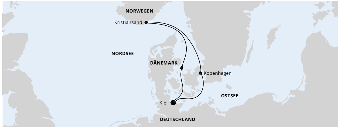
Die Karte zeigt eine optisch vereinfachte Route. Änderungen vorbehalten.

AIDA luna | 4 Tage | April, September und Oktober 2024