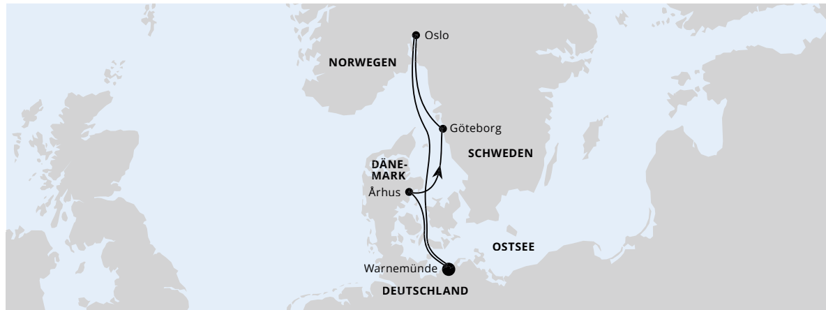
Die Karte zeigt eine optisch vereinfachte Route. Änderungen vorbehalten.

AIDamar | 5 Tage | Mai, Juli und August 2024