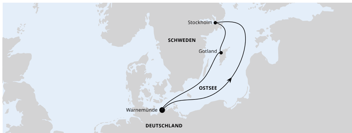
Die Karte zeigt eine optisch vereinfachte Route. Änderungen vorbehalten.