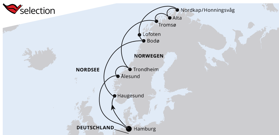
Die Karte zeigt eine optisch vereinfachte Route. Änderungen vorbehalten.