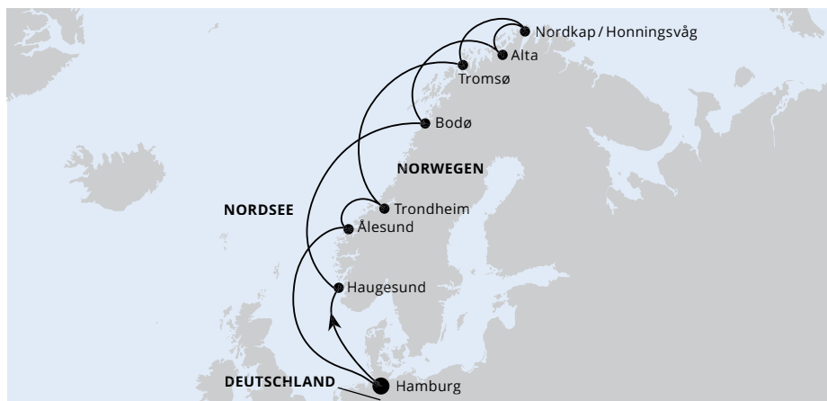
Die Karte zeigt eine optisch vereinfachte Route. Änderungen vorbehalten.