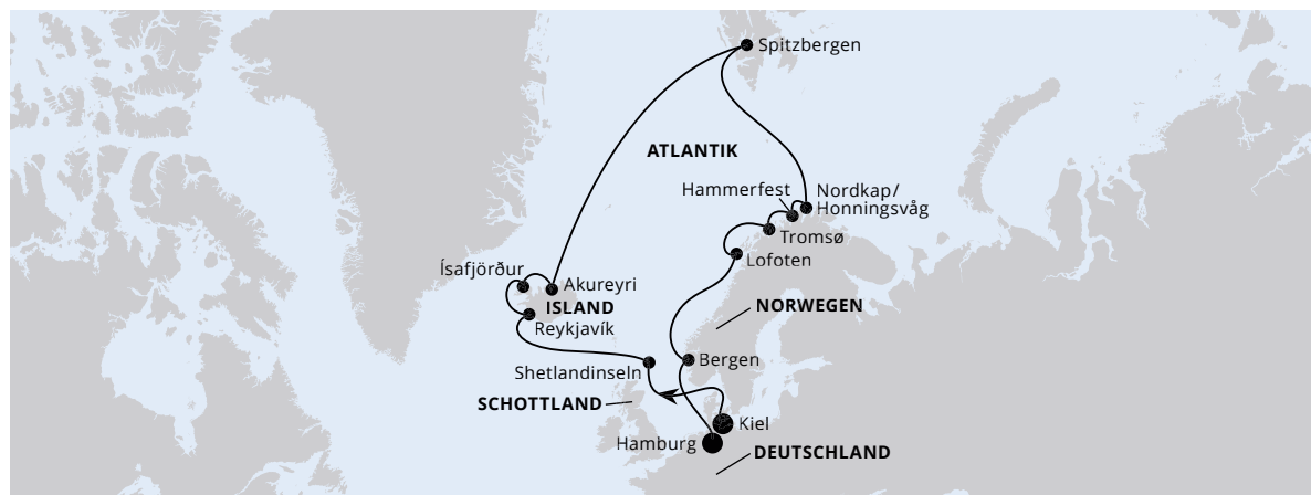
Die Karte zeigt eine optisch vereinfachte Route. Änderungen vorbehalten.