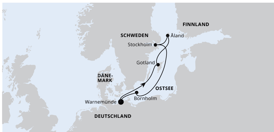
Die Karte zeigt eine optisch vereinfachte Route. Änderungen vorbehalten.