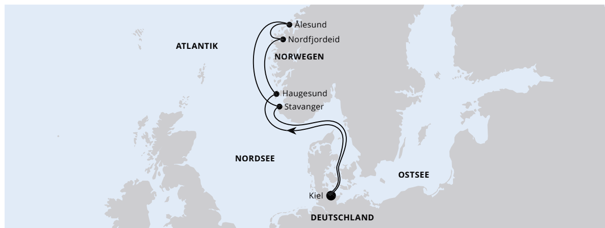
Die Karte zeigt eine optisch vereinfachte Route. Änderungen vorbehalten.

AIDAnova | 7 Tage | Mai bis Oktober 2024