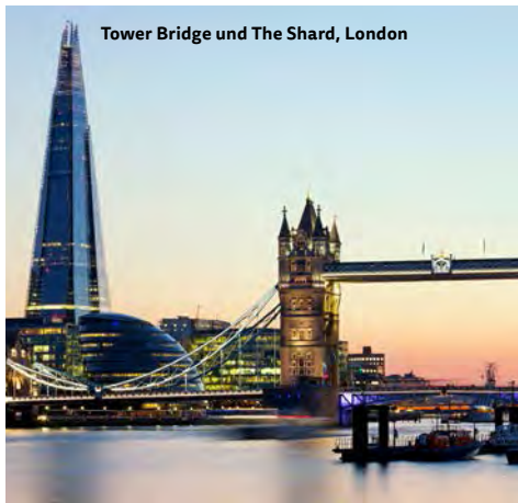
Tower Bridge und The Shard, London