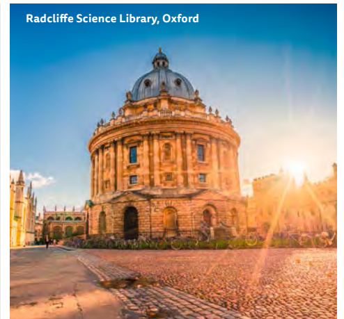
Radcliffe Science Library, Oxford