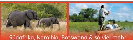
Südafrika, Namibia, Botswana & so viel mehr